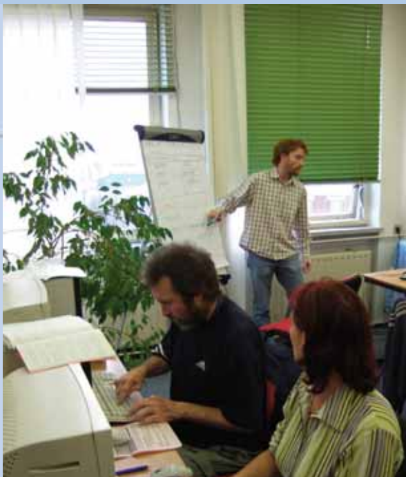
Kurz práce na PC Restart pokročilí