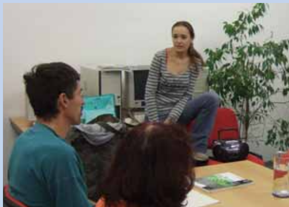
Kurz anglického jazyka pokročilí