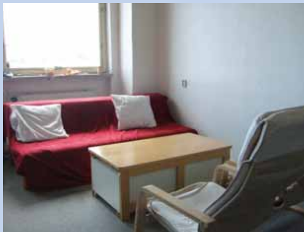
Konzultační místnost organizace