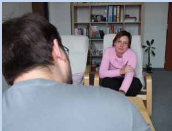
Konzultace s uživatelem poradny

Počet pracovníků: 5 lidí na 3,5 úvazku, z toho dva s těžším zdravotním znevýhodněním