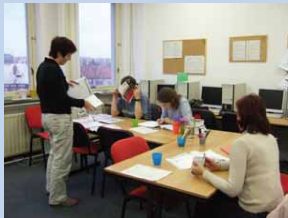
Kurz anglického jazyka mírně pokročilí

Další oblastí, do které projekt „Kvalita“ zasáhl, bylo plánované založení sociální firmy . Vzhledem k tomu, že naše organizace pracuje v oblasti podpory zaměstnávání lidí se zdravotním postižením, považujeme založení soc. firmy za další logický krok v naší činnosti. V rámci projektu jsme provedli ekonomické analýzy a proběhly konzultace k této problematice.