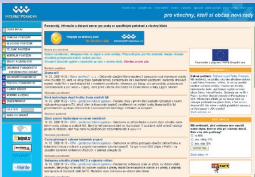
Úvodní stránka webového poradenství