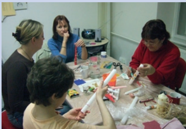
Kurz kreativních technik (Restart)