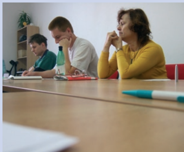
Kurz základy administrativy

Tato služba se vyvinula z projektu financovaného strukturálními fondy, který realizujeme od března a byla zaregistrována dle zákona o sociálních službách v říjnu 2007. Hlavním cílem je podpořit lidi se zdravotním znevýhodněním v jejich integraci do většinové společnosti. Součástí služby je individuální sociální práce, skupinové setkávání a v případě zájmu uživatelů i podpora při zvýšení kvalifikace a pracovního uplatnění a zapůjčení počítačů. Součástí projektu bylo v loňském roce rozsáhlejší vzdělávání v práci s počítačem, sociálních a pracovních dovednostech, administrativě a angličtině. Služba je poskytována zdarma v místě kontaktní adresy sdružení.