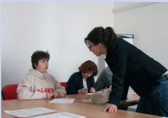
Kurz angličtiny (Restart)